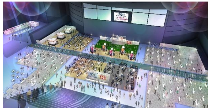
リアル会場イメージ

「さいしんビジネスフェア」は、2015年から隔年で開催しているビジネスマッチングイベントで、前回の2021年からリアルとオンラインのハイブリッド型で実施しております。今回も同様にハイブリッド型での実施となりますが、会場での活発な商談に向け、リアル会場に重点を置いた開催を予定しております。