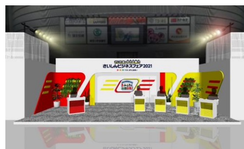
メインスタジオ イメージ