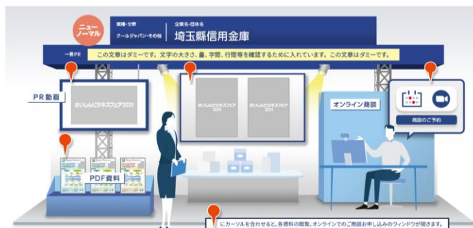
オンライン出展ブース イメージ

リアル会場でのイベントをオンラインでも同時配信。オリジナル番組3チャンネル「メインチャンネル」「ビジネスチャンネル」「オンラインショッピングチャンネル」を開局。