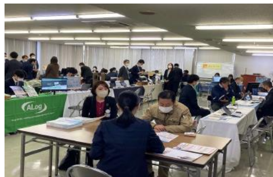
昨年春日部支店主催で開催された 「DX 体験イベント」の様子

当金庫は DX 関連イベントの開催を通じ、取引先企業の DX に向けた支援を加速してまいります。