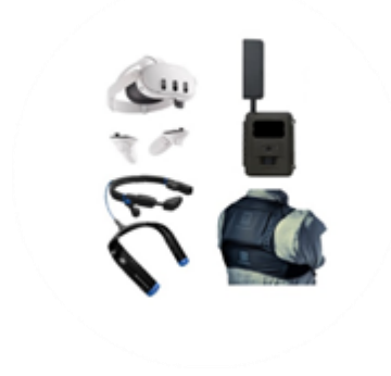
スマート農業用品