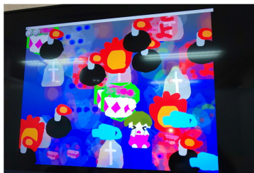
自分の描いた絵が動く「ビスケット」の体験も！