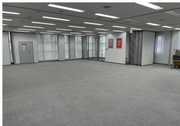
川口朝日支店 2階会議室