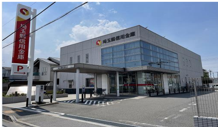
川口朝日支店 外観

当金庫は今後もヤングケアラーや子どもたちの支援を通じSDGsが目指す「誰一人取り残さない」社会を実現する活動を続けてまいります。