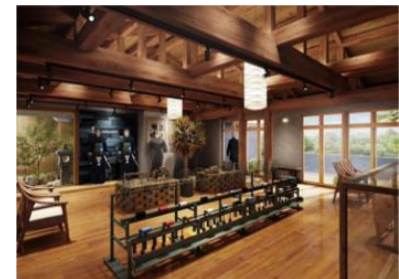
野川染織工業直営店「甕覗き」 (埼玉県羽生市須影 471-4)