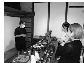
はかり屋ほか見学（越谷）