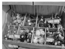
チャヴィペルトほか見学（草加）