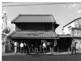
八百宿ほか見学（杉戸・宮代）