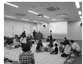
上尾支店開催「赤ちゃんサロン」