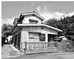
株式会社80パーセント

川越市駅より徒歩6分の空き家を借り上げ、シェアオフィスにリノベーションした施設です。地域での創業、まちづくりプレイヤーの活動支援をさらに加速させていきます。