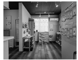
有限会社アンサンブルアスク

旧歯科医院の建物をリノベーションし、フリースペースやハンドメイド作品などを委託販売できるショッピングエリアなどを運営しています。小さなお子さま連れでも安心して過ごせる新しい形のお店です。