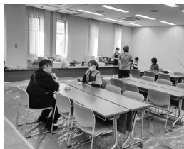
川口朝日支店開催「子ども食堂」

NPO法人や社会福祉協議会と連携し、ケアラー支援や子どもたちの居場所づくりに関するイベントに、当金庫会議室を無償で貸し出しております。